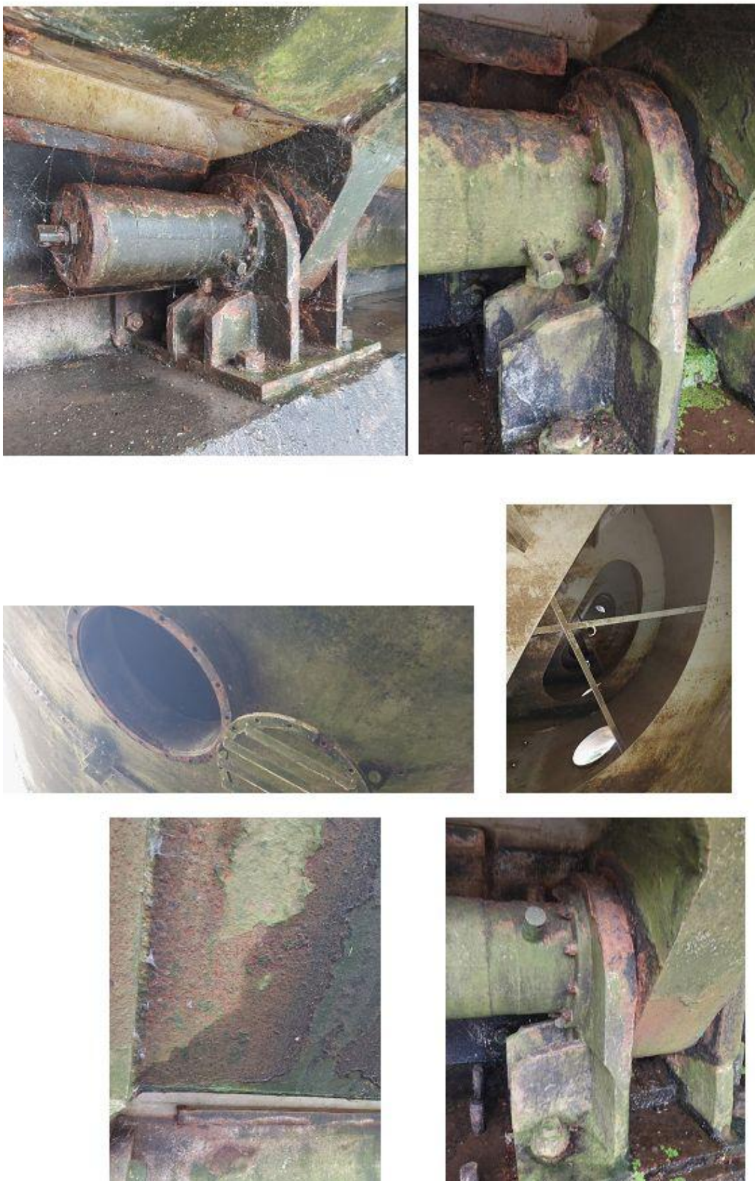
Obr. č. 2 – Stávající poškození protikorozní ochrany jezu.