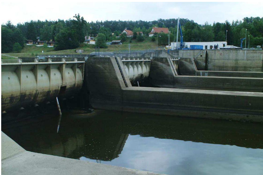
Obr. č. 1 - Pohled na jez z dolní vody.